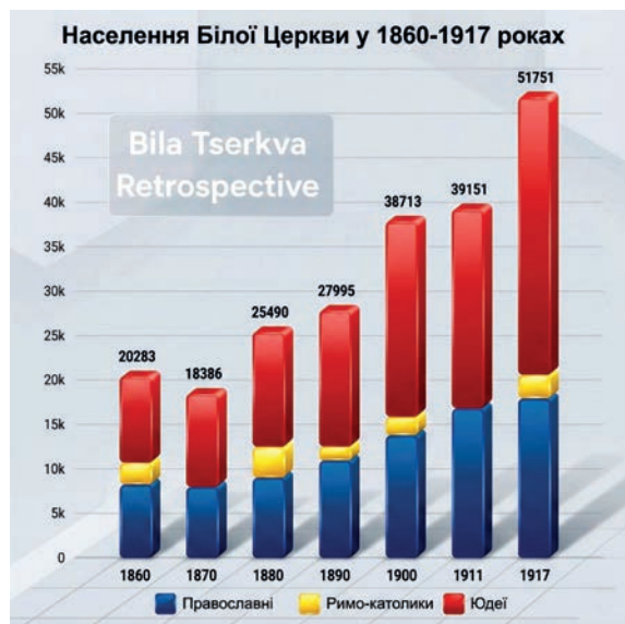
Динаміка зміни кількості населення Білої Церкви в 1860–1917 рр., за даними клірових відомостей із ЦДІАК (ф. 127, оп. 1011). Автор О. Дедуш

Значною віхою в житті білоцерківців стало відкриття радонових вод у межах міста. Для багатьох жителів російської імперії це стало шансом покращити своє здоров'я, тому тут почали з'являтися перші оздоровчі установи. Показовим є факт, що для місцевих жителів радонові води мають обмежений ефект, оскільки вони тривалий час проживають біля їх джерел.