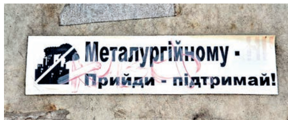
Протестна листівка 2006 р. проти металургійного заводу на Проспекті Незалежності. 23.07.2025 р.

Не повністю завершено процес очищення громади від представництв РПЦ в Україні. Зокрема, ця російська структура станом на листопад 2025 року контролює пам'ятку архітектури – Магдалинську